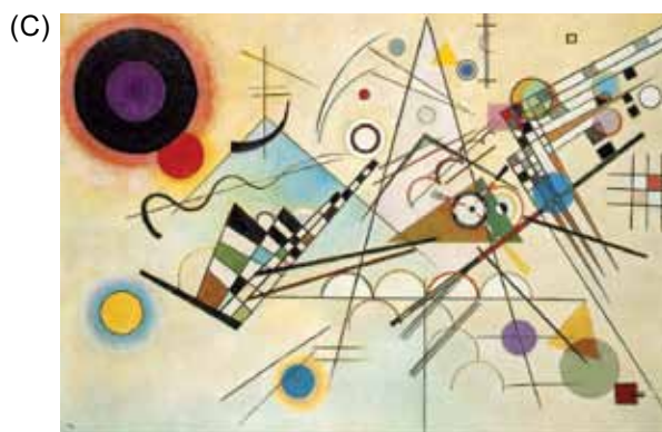
(Wassily Kandinsky. Composição VIII .)