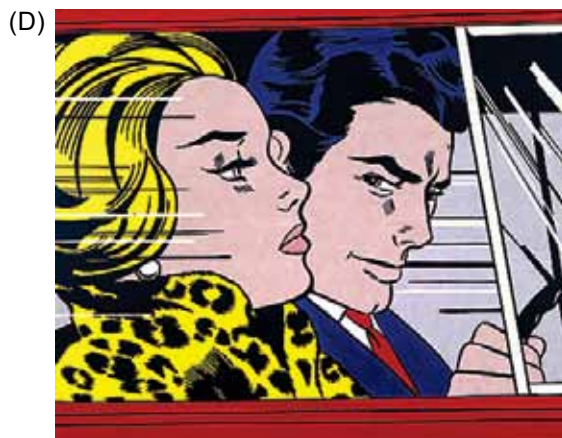
(Roy Lichtenstein. No carro .)