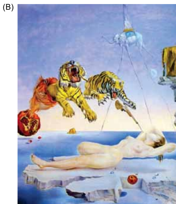
(Salvador Dalí. Sonho causado pelo voo de uma abelha ao redor de uma romã um segundo antes de acordar .)